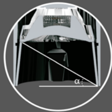
30° ângulo de proteção cut off ângulo de proteción