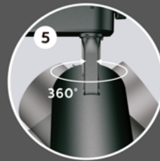
360° rotação rotation rotación