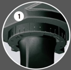
escala de ângulos protactor